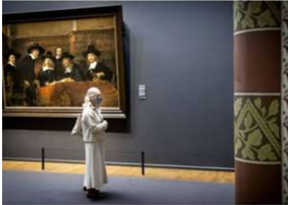
zoeker van het Rijksmuseum, in september